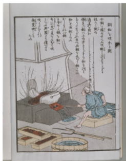
庆长年间（1596-1615） 住友开发成功的新技术 “南蛮吹”