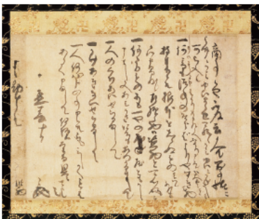
政友留下的《文殊院旨意书》