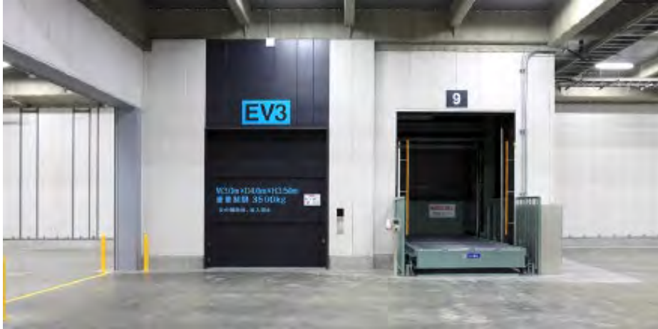
荷物用エレベーター・垂直搬送機

・上下階の荷物を搬送効率化を目指し、最新鋭の荷物用エレベーター及び垂直搬送機を設置。