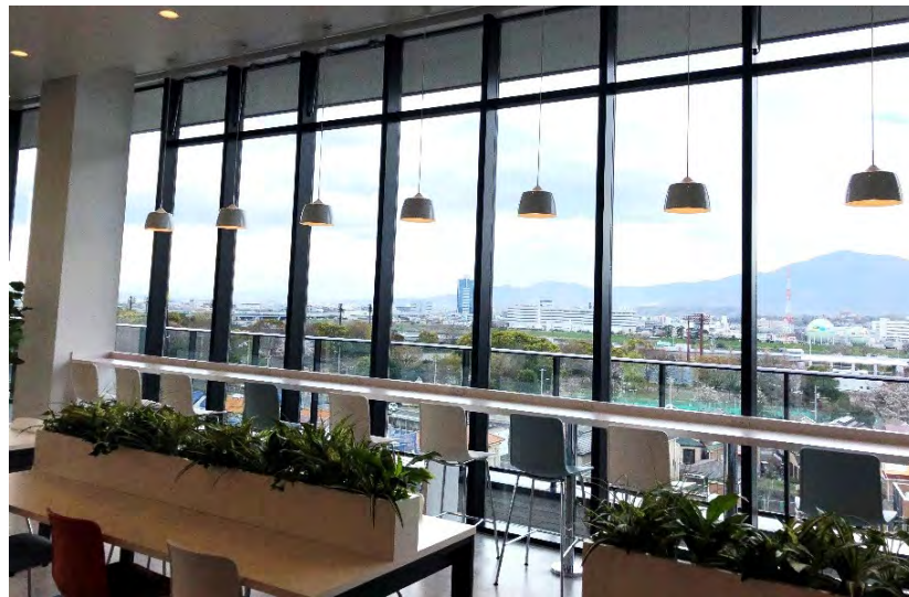
エントランスホール