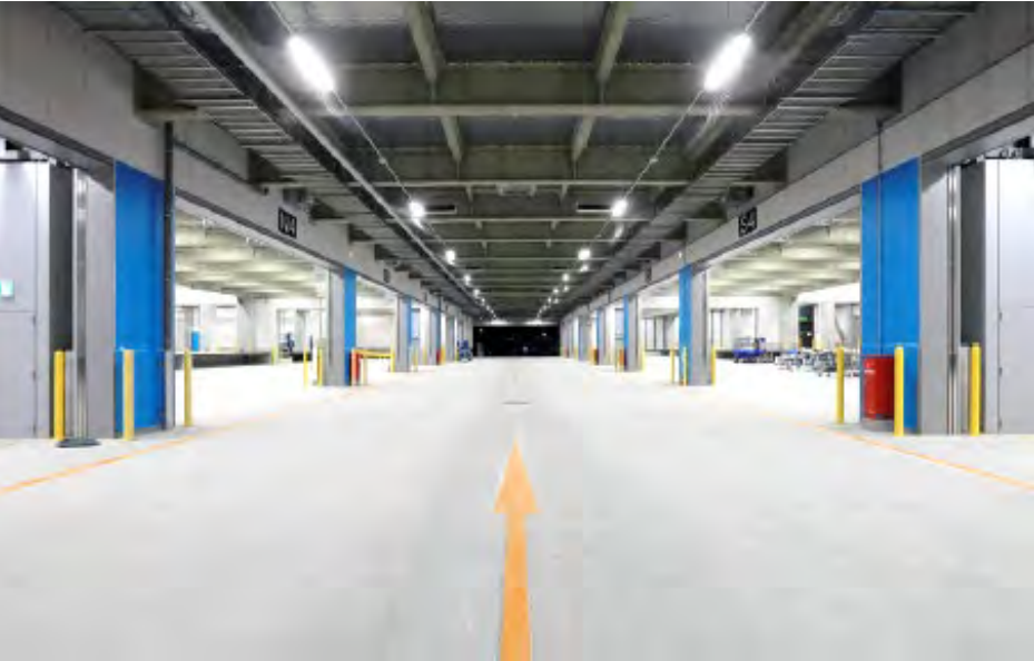
中央車路・倉庫内