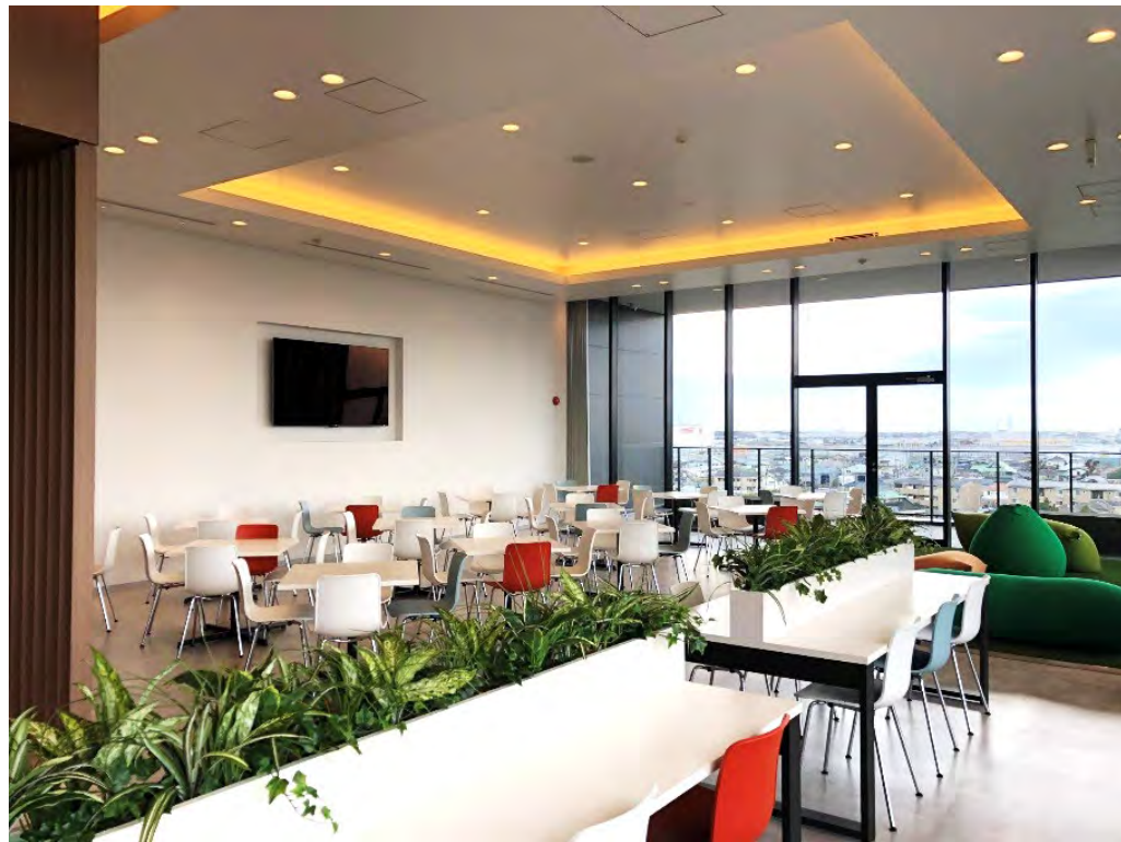
富士山を望む最上階ラウンジ