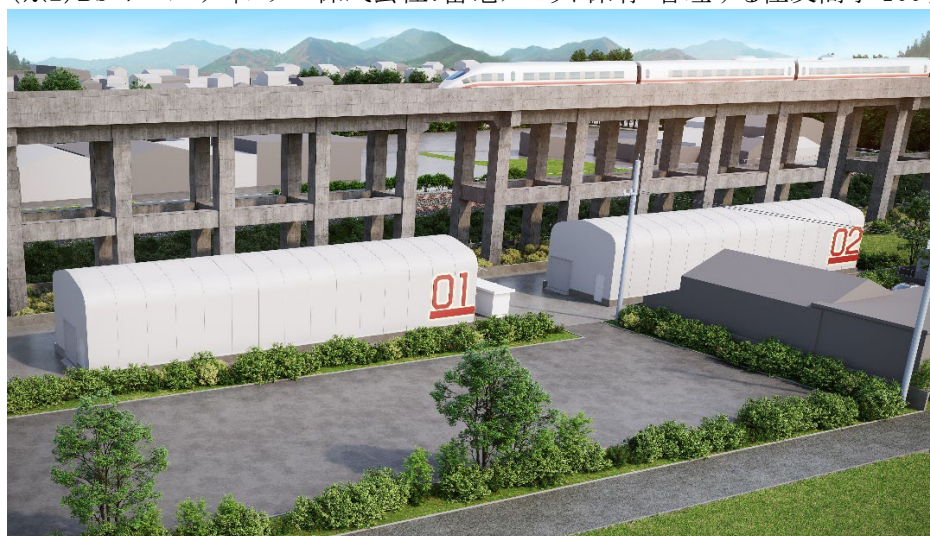
図 2 1 号案件(熊本県熊本市内)

(※2)BS ホールディングス株式会社:蓄電アセット保有・管理する住友商事 100%子会社