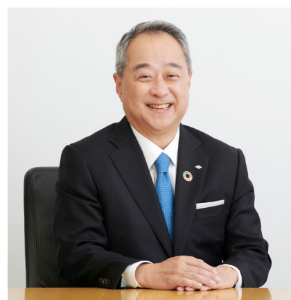
住友商事株式会社 代表取締役 社長執行役員CEO

私は、全役職員の皆さんが、コミュニケーションよく自由闊達に意見を言い合い、安心して、誇りをもって価値の創造に向かっていける住友商事グループでありたいと、決意を新たにしています。コンプライアンス最優先への皆さん一人ひとりの真の理解と協力のもと、「Enriching lives and the world」を体現し、進化を続ける住友商事グループの一員として、共に歩んでいきましょう。