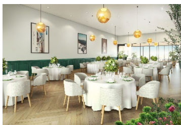
＜バンケット イメージ＞