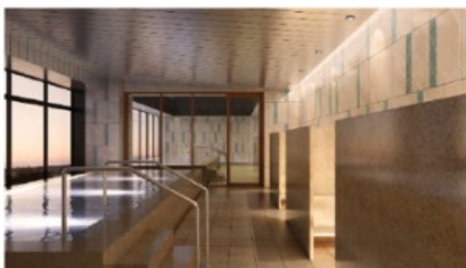
＜宇都宮市街や山々が一望できる天空スカイスパ(14F)＞