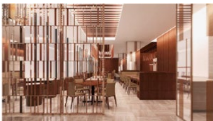
＜宇都宮市街の美しい眺望が望めるレストラン(13F)＞

商業施設と並んで5階～14階部分にオープンする宿泊施設「カンデオホテルズ宇都宮」では、地域の特産品を積極的に活用したレストランを併設。さらに屋上には旅の疲れを整える、男女ともに最新のロウリュサウナを備えるスカイスパも完備します。