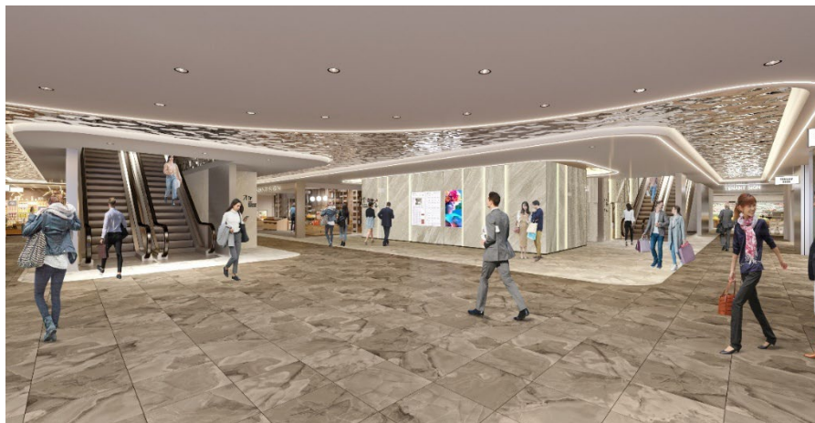
内装パースイメージ<B1F>

□内装 「水面（みなも）」をテーマに[Water Flow]というコンセプトで、水のゆらぎや浮遊感を感じさせる空間演出を採用。光や曲線による自然な誘導設計により回遊性を高め、ガラスケーシングの統一ファサードが開放感と上質さを演出するフロア構成。