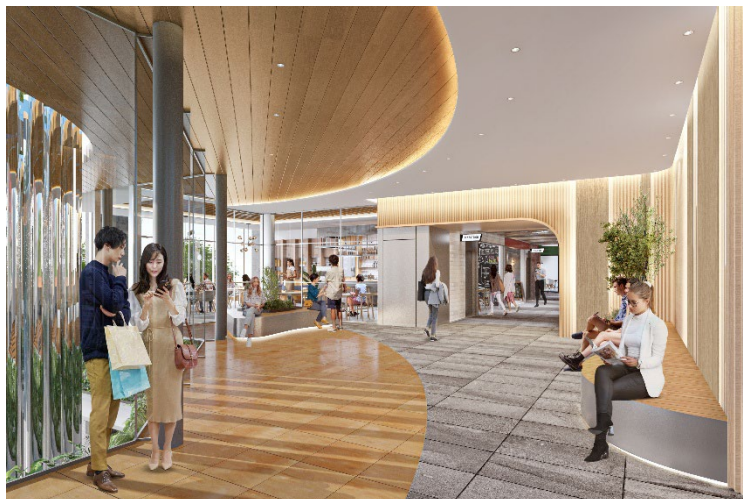
内装パースイメージ<2F>