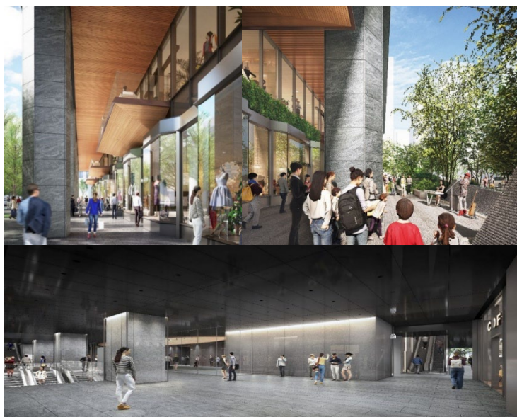
外装・内装パースイメージ<1F>

□内装 「街」をテーマに[Glass Cube]というコンセプトで、透明感あるガラスケーシングで統一された上質な都市型ストリートを形成。見通しを確保したファサード設計により、オフィスエントランスとしての品格と商業としての賑わいを両立する空間を実現。